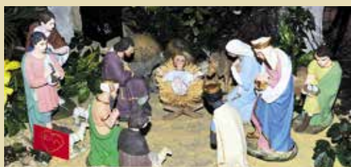
La crèche de Charly.