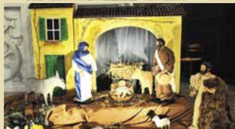
La crèche de Vourles.