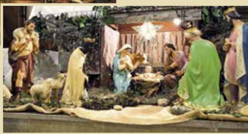
La crèche de Vernaison.