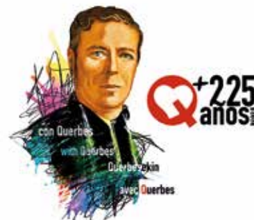
Logo espagnol : 225 e anniversaire de la naissance du père L. Querbes

Sous la croix qui préside le cimetière de Vourles, nous trouvons la pierre tombale du père L. Querbes, avec l'inscription suivante :