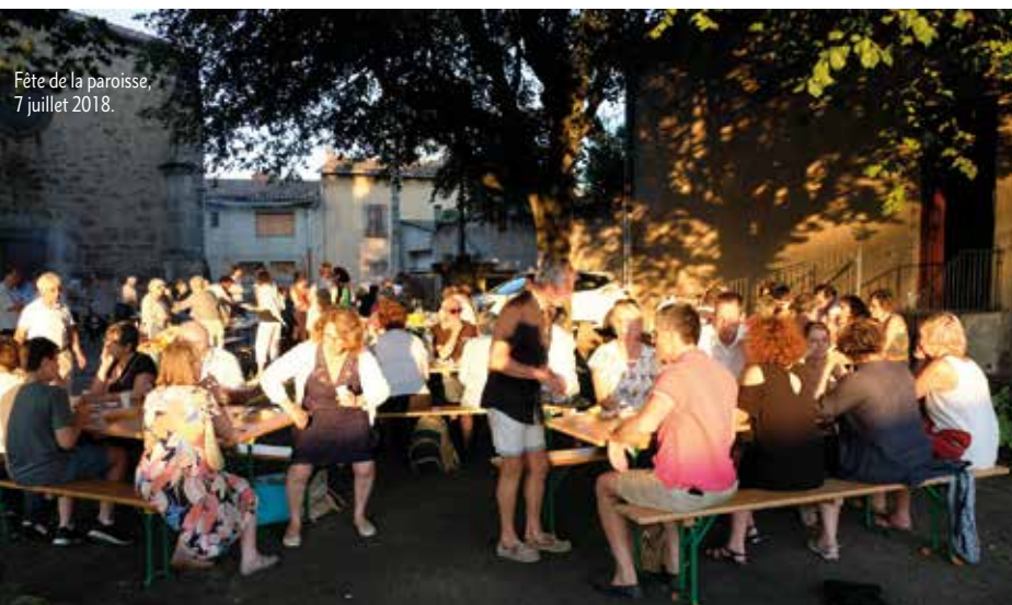
Fête de la paroisse, 7 juillet 2018.