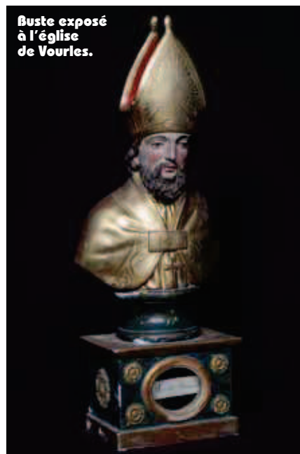
Buste exposé à l'église de Yourles.

*Austrasie : royaume oriental de la Gaule franque (capitale : Metz) dont est originaire la dynastie carolingienne, constitué en 511, à la mort de Clovis. Pépin de Herstal, maire du palais, lui adjoignit le royaume de Neustrie, au nord de la Loire, faisant ainsi l'unité des royaumes francs.