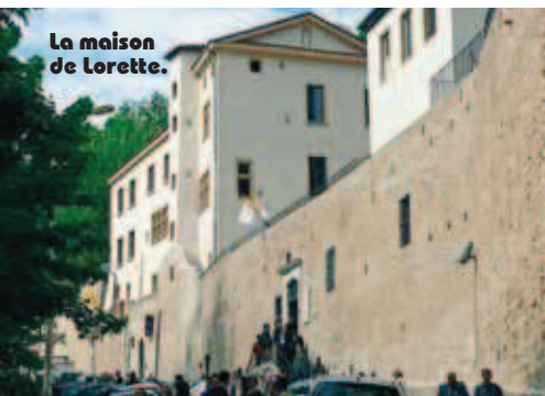
La maison de Lorette.